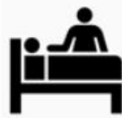
照顧生活不能自理 的受隔離或檢疫者 之家屬