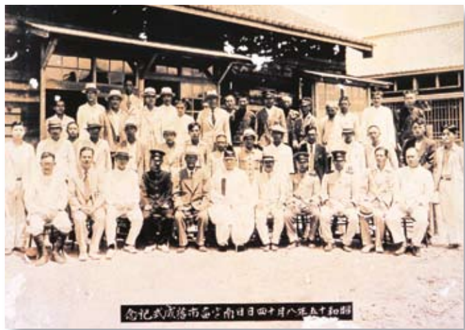
照 5-6-2 昭和 15 年（1940），成立買賣雞、鴨、鵝之家畜市場，址在日南市場（大甲鎮臨江路）附近，今已改建。