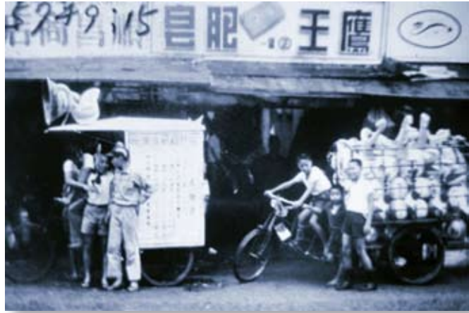
照 5-6-3 「舊大甲第一市場」：民國 23 年（1934）所興建，大甲最早之傳統市場，市場樓上設有圖書館，今已改建。圖中左方有三輪宣傳車，右方為塑膠玩具之攤販，代表當時之促銷與銷售方式。照片攝於民國 57 年。