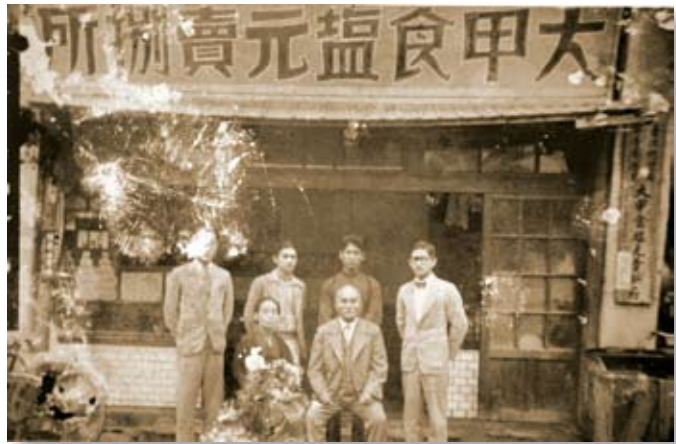
照 5-6-1 「大甲食鹽賣所」：食鹽配銷所。日治時期食鹽、香煙、酒、鴉片為公賣，由政府統一製作，配銷到各地。照片址在今岷山里金華路（當時大街：順天路）。