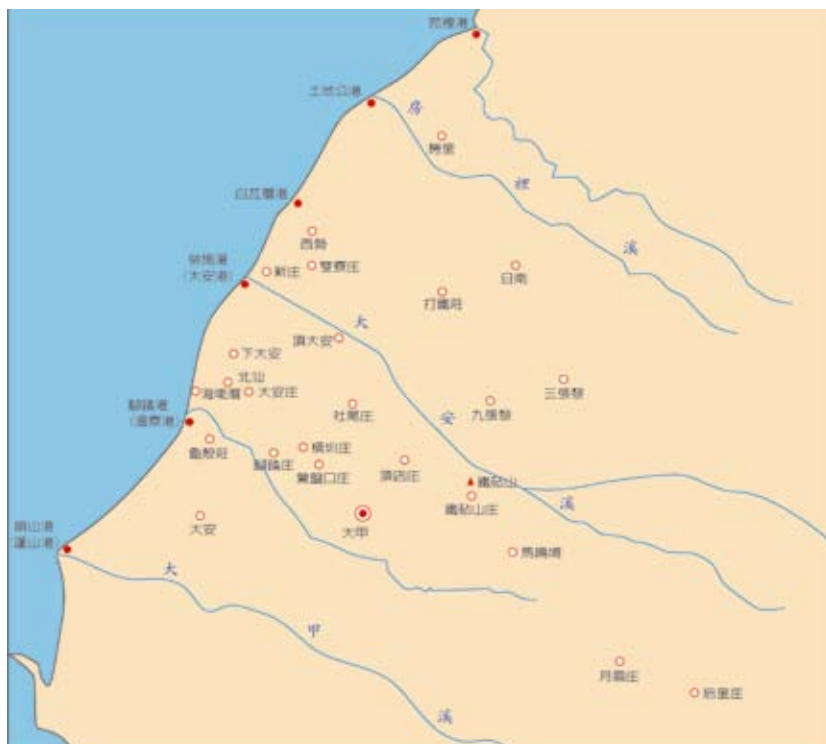
圖5-6-1 清代鄰近大甲地區之對外通商港口

資料來源：前引楊秀雅，《清代大甲地區的發展與街市的形成（1684-1895）》，頁 67。