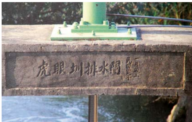
照 5-1-1 虎眼大圳：虎眼圳排水閘民國 49 年 1 月竣工。(雷養德提供)

資料來源：前引楊秀雅，《清代大甲地區的發展與街市的形成 (1684-1895)》，頁 71-73