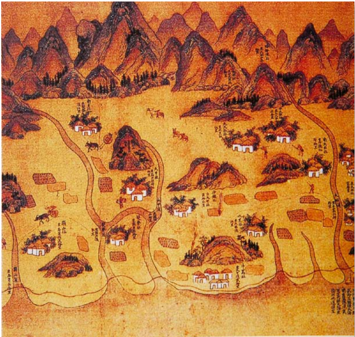
圖5-1-2 清康熙中葉臺灣輿圖（大甲、大安溪兩岸部份）