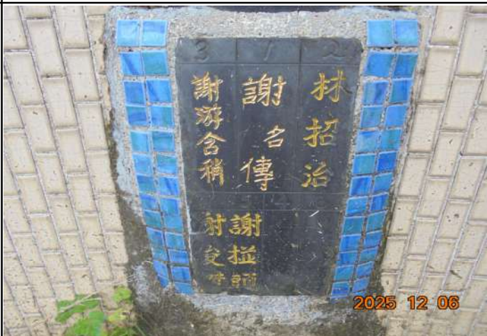
2、受葬姓名牌相片：5人