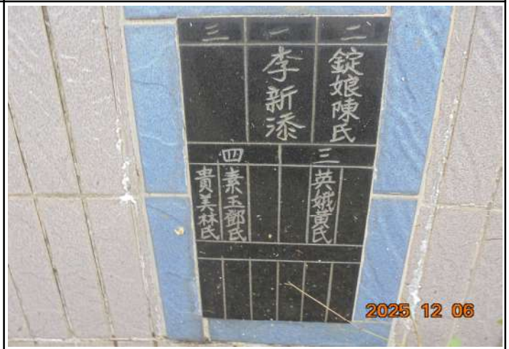
2、受葬姓名牌相片：5人