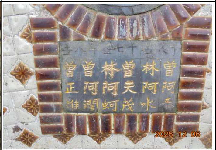
2、受葬姓名牌相片：6人