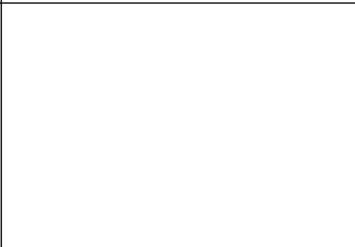
2、受葬姓名牌相片：2人