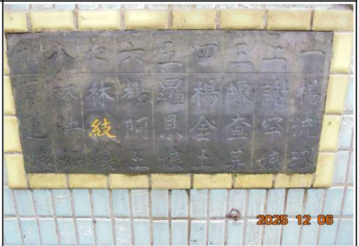
2、受葬姓名牌相片：9人