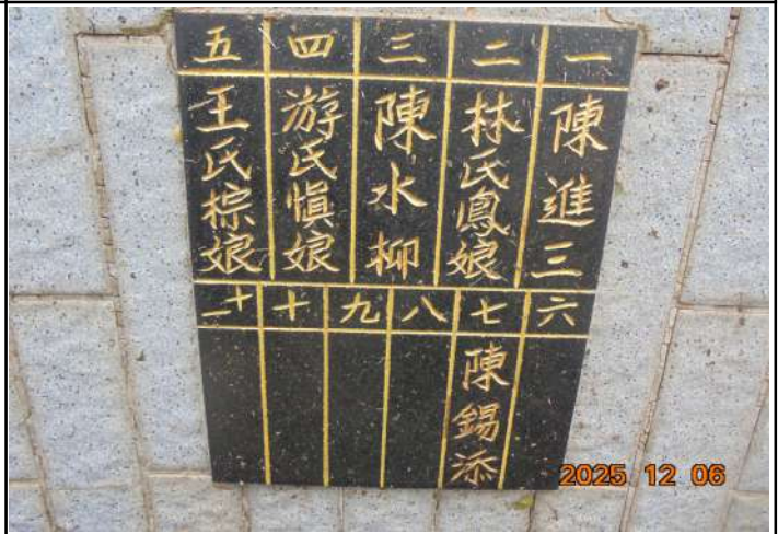
2、受葬姓名牌相片：6人