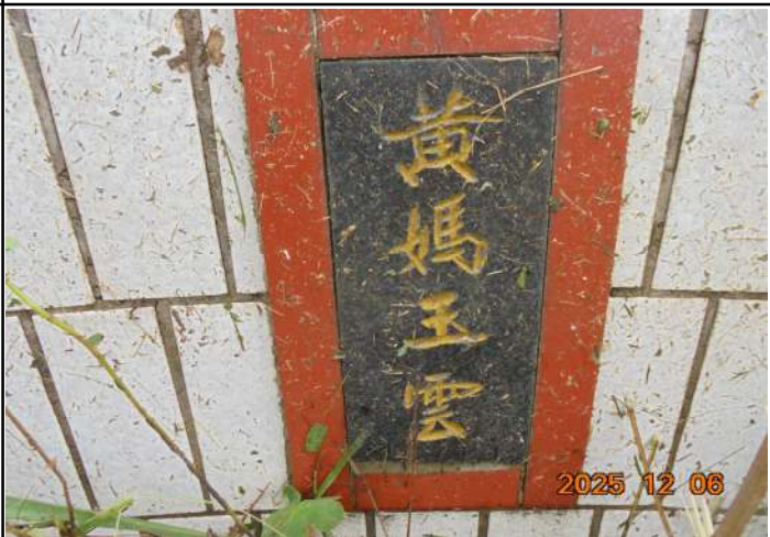
2、受葬姓名牌相片：1人