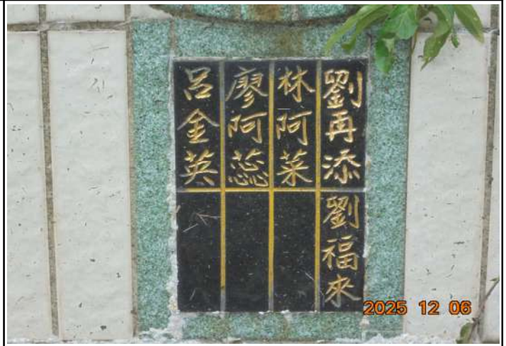
2、受葬姓名牌相片：5人