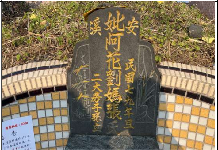
2、受葬姓名牌相片：1人