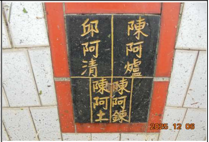
2、受葬姓名牌相片：4人