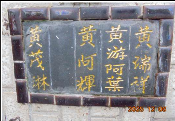
2、受葬姓名牌相片：4人