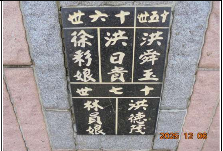
2、受葬姓名牌相片：5人