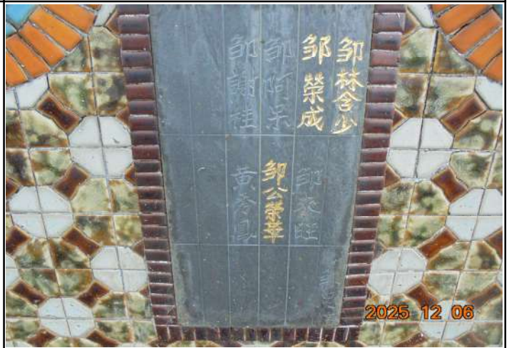
2、受葬姓名牌相片：8人