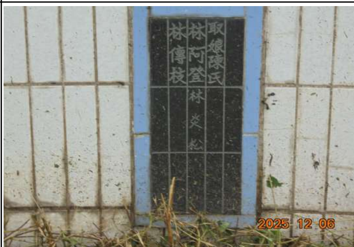
2、受葬姓名牌相片：4人