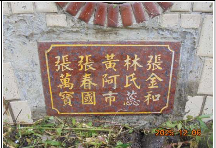
2、受葬姓名牌相片：5人