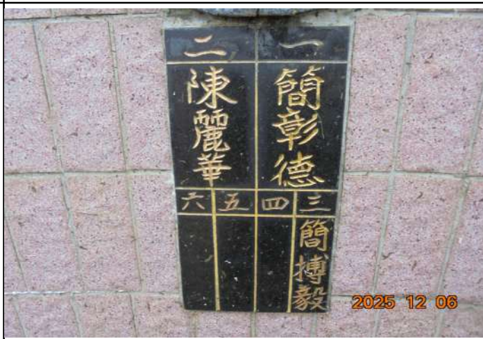
2、受葬姓名牌相片：3人