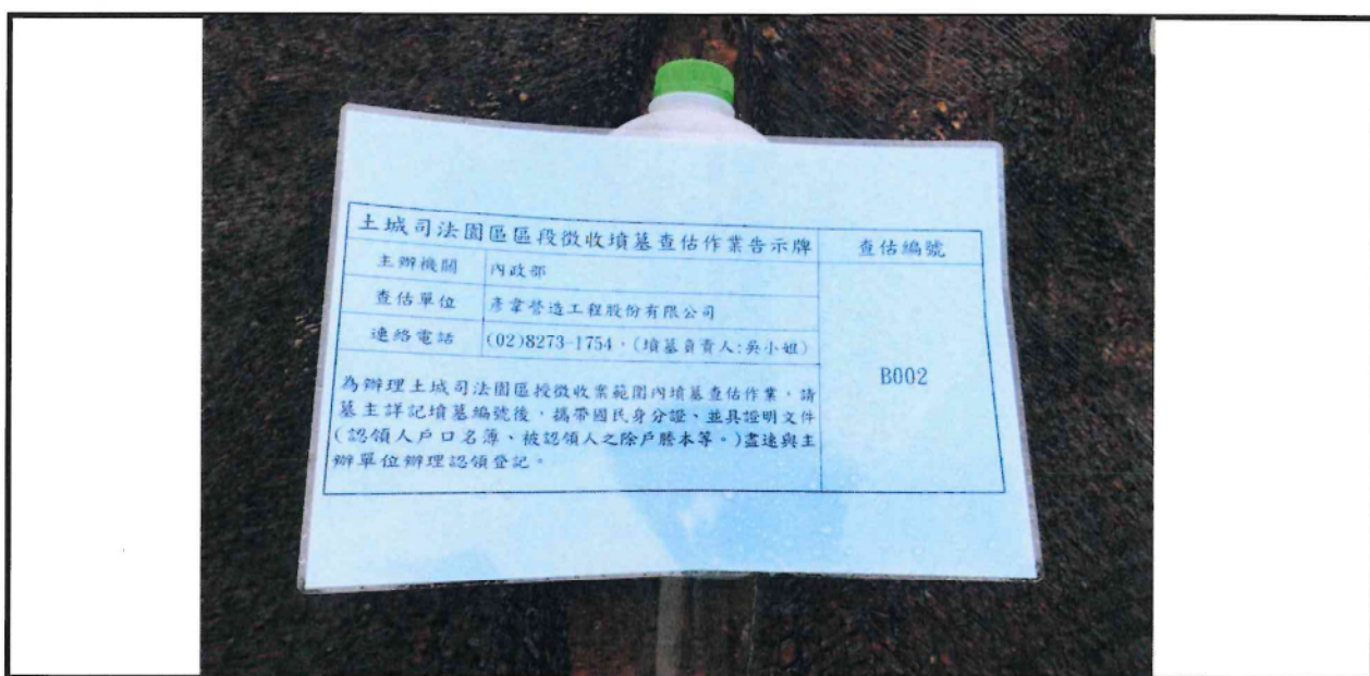
墓碑近照(含告示牌)