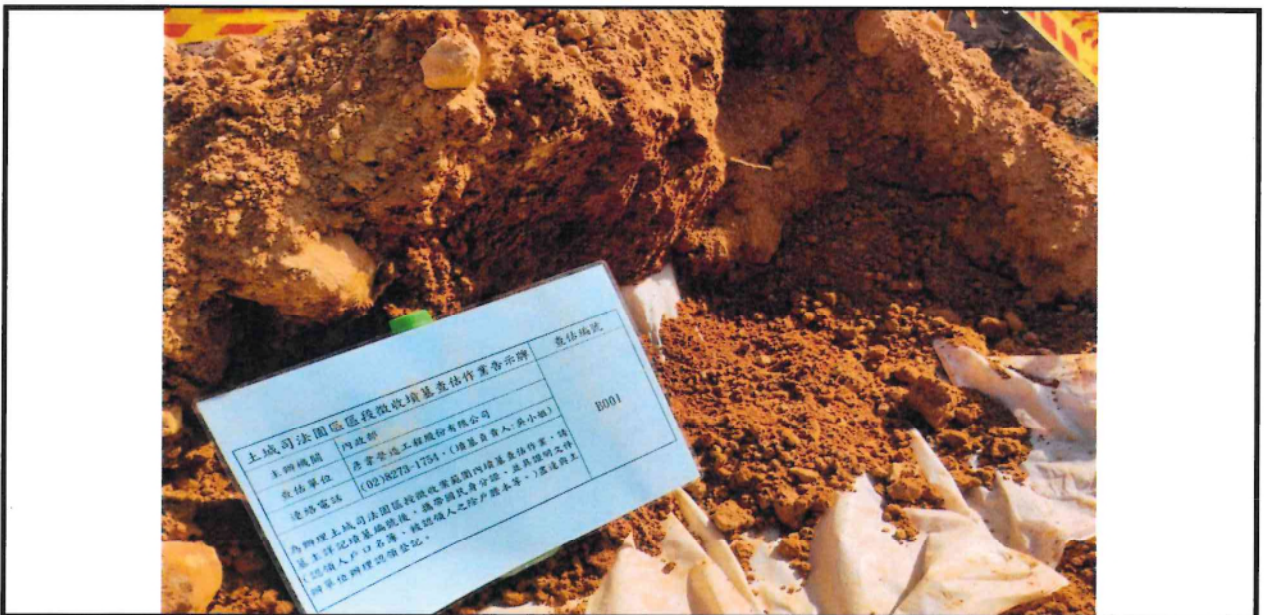
墓碑近照(含告示牌)